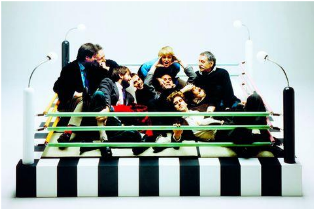
Grupo Memphis: los diseñadores que marcaron la estética de los 80

Bay Center, un collage de diseño de Gropius, Le Corbusier, O. Niemeyer, F. Lloyd Light... Mientras trabajaba como consultor en el estudio de sistemas de diseño y decoración de Olivetti de 1970 a 1979, conoció a Ettore Sottsass. En 1981, Umeda diseñó su objeto más famoso para Memphis, el ring de boxeo Tawaraya , en el que Studio Azzurro fotografió a los miembros fundadores del grupo para crear una de las imágenes más icónicas de Memphis. "Estoy muy feliz de saber que Tawaraya se convirtió en un producto representativo de la marca Memphis después de 40 años" reconoce Umeda.