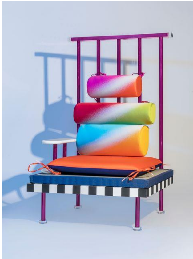
Cortesía de Memphis Milano