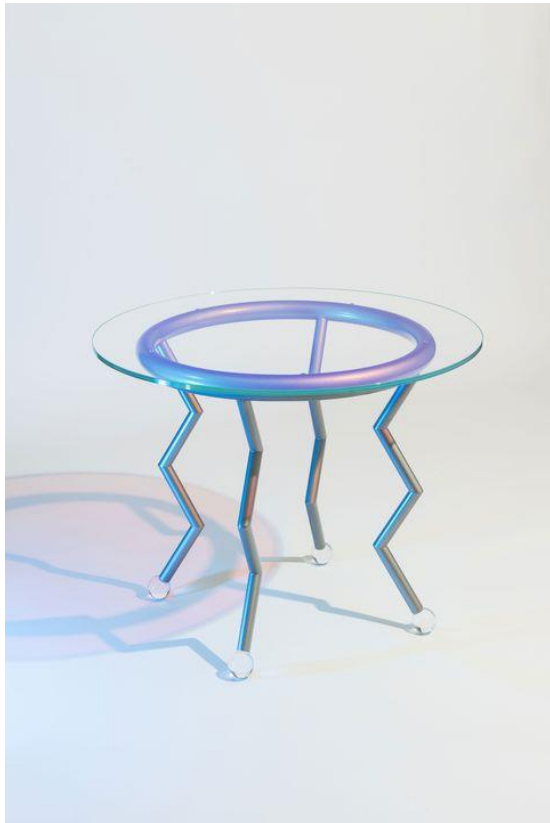
Cortesía de Memphis Milano