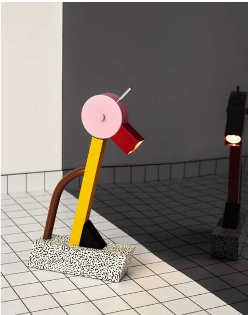
Lampada da tavolo Tahiti di Ettore Sottsass