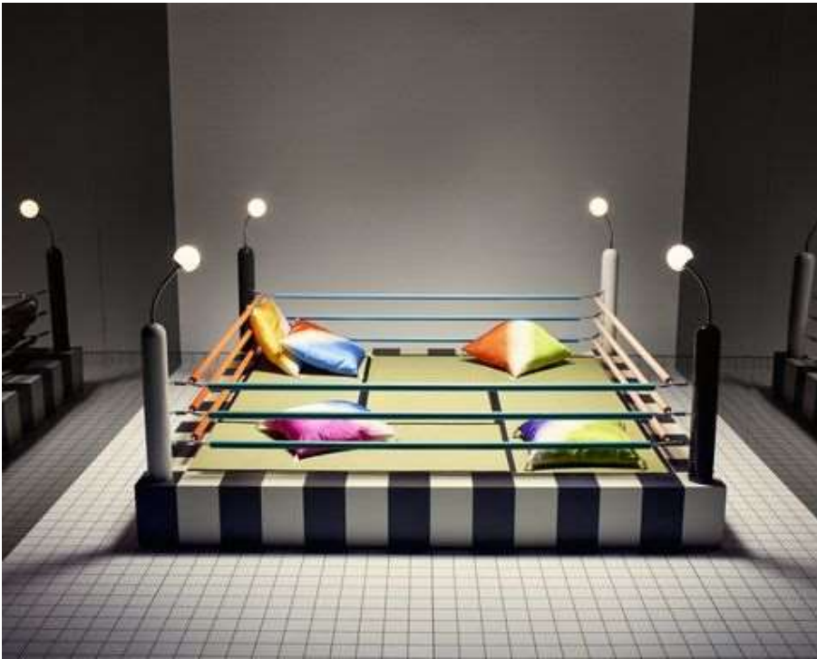
Il letto Ring disegnato da Masanori Umeda