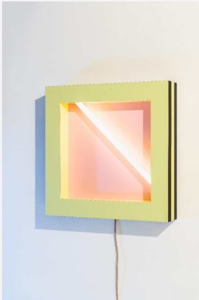
Negresco, Martine Bedin, Memphis-Milano, 1981, Wall lamp in wood and plastic laminate with alternating layers of colour, and with a neon light embedded within the frame.

Disegnata appunto nel 1981, il corpo illuminante da parete in legno e laminato plastico dal nome Negresco, gioca su strati alterni di colore che incorniciano il neon interno alla struttura. Chiamata come lo storico hotel dal fascino esclusivo, fondato nel 1913 da Henri Négresco a Nizza, ci porta con la fantasia sulle rive morbide bagnate dal mar Mediterraneo della Promenade des Anglais, che ha regalato dolci sogni a diverse generazioni. Martine Bedin infatti ricollega la sua lampada ai dolci con pistacchio e fragola: un oggetto ricco di contrasti fatto di materiali dai colori pieni e assoluti e dagli accostamenti audaci come rosa, giallo, verde chiaro e nero. La Galleria Post Design continua le celebrazioni del marchio: a breve seguiranno nuove riedizioni di Arata Isozaki e Aldo Cibic .