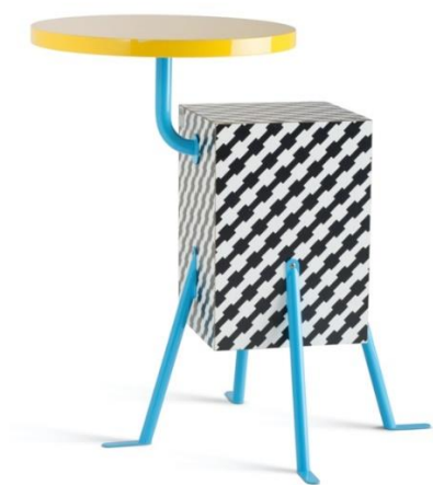
Tavolini Kristall, di Michele de Lucchi, 1980/81

Scopri la mostra Home Stories: 100 anni, 20 interni visionari , al Vitra Design Museum fino al 28 febbraio 2021